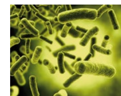
Salmonella : bactérie responsable de la salmonellose

Toutes les bactéries ne sont pas pathogènes, il y a environ une centaine d'espèces pathogènes, sur 5000. Certaines bactéries vivent en symbiose avec l'homme, par exemple de nombreuses bactéries dans le tube digestif sont indispensables à la digestion, la production de vitamine K... Cependant, il existe de nombreuses espèces dangereuses à l'origine de beaucoup de maladies infectieuses comme le choléra, la syphilis, la peste, la lèpre, l'anthrax, la tuberculose ou responsables d'intoxications.